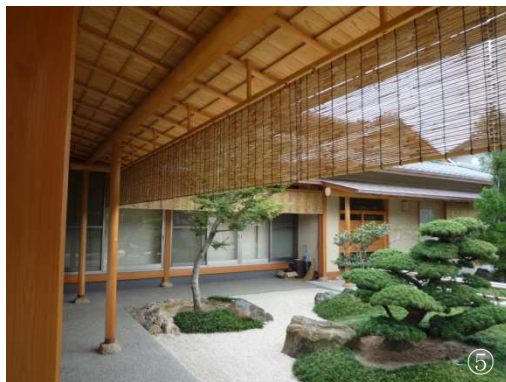
①外掛簾 ②座敷簾 ③葎障子 ④座敷簾（イタリアにて） ⑤外掛簾

弊社は明治16年（1883年）に初代久保田清次郎が創業して以来、簾や竹工芸品を製造販売してまいりました。神社仏閣で使用される御翠簾をはじめ、外掛簾、内掛簾、葎障子、花寄屏風、竹工芸品など多様な製品を手がけております。材料には琵琶湖産の葎や京都府産の竹などを用い、天然素材ならではの風合いを生かした製品づくりをしております。